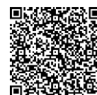
再生医療 関連製品

細胞培養 関連製品： https://labchem-wako.fujifilm.com/jp/category/lifescience/mammalian_cells/index.html