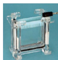
ゲルのセット完了！