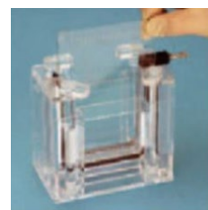
バッファーを捨てずにゲルを取り出します