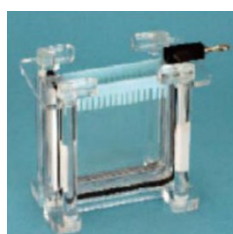
カバーを外します