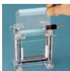
ゲルを差し込みます