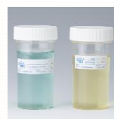
左：コンパレータ 右：培養後の検体 (結果は陰性)

検体と比較するためのコンパレータ(比色管)です。 検体の方が青みが薄ければ陰性と判断できます。