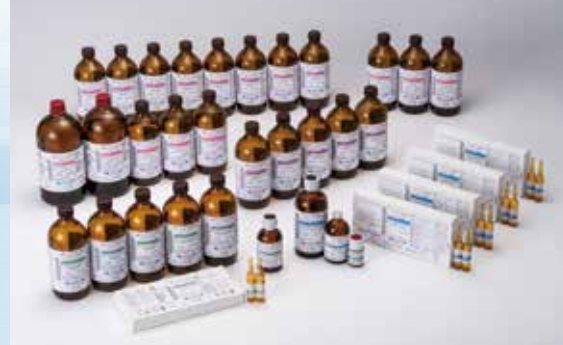
三菱ケミカルアクアミクロン™

日東精工アナリテックは、装置と試薬を 一体で販売し、世界中で豊富な実績と信頼性に 基づく製品・技術サービスをご提供します。