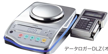
データロガーDLZ(オプション)と 取り付け金具(オプション)使用